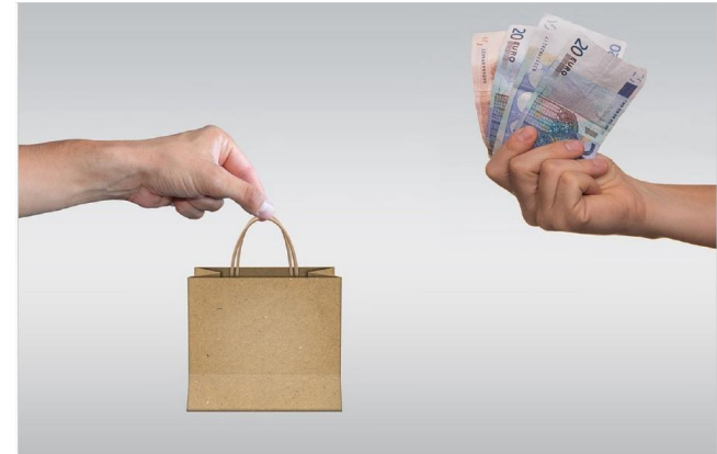
Quick scan leges

Het ontbreekt aan regie op aanbevelingen die aan de raad zijn gericht: deze 'landen' tijdens de behandeling bij het college.