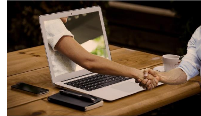
Quick scan externe inhuur