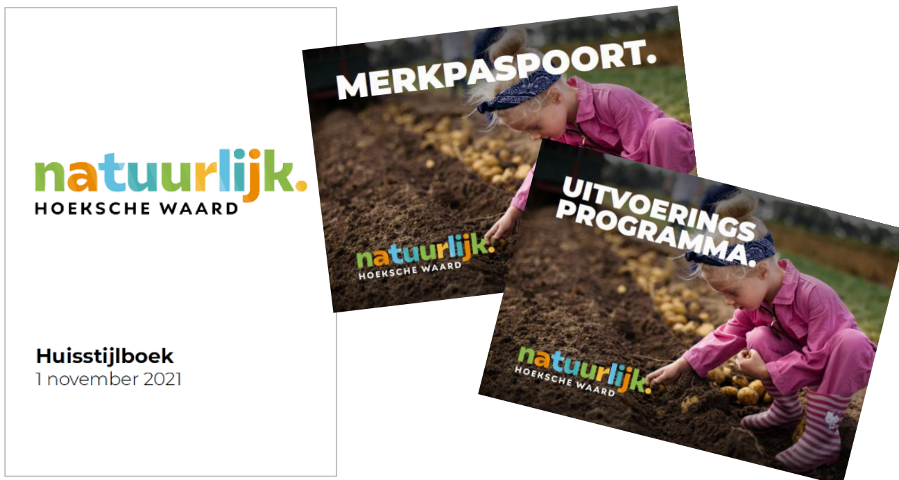
Figuur 3: Het huisstijlhandboek, merkpaspoort en uitvoeringsprogramma (2021)

Na besluitvorming heeft de gemeente opdracht gegeven aan een reclamebureau om de huisstijl en het merkpaspoort te ontwikkelen. 13 Tegelijkertijd is gewerkt aan het uitvoeringsprogramma (met KPI's). In november 2021 worden het uitvoeringsprogramma, merkpaspoort en huisstijlboek gebiedsmarketing Hoeksche Waard via een raadsinformatiebrief aangeboden aan de gemeenteraad (zie Figuur 3).