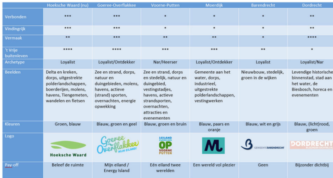
Figuur 1: Concurrentieanalyse