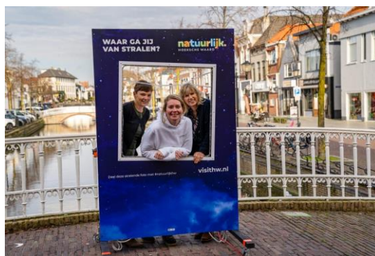
Figuur 5: Fotoframe voor de campagne ‘Waar ga jij van stralen?’

Op initiatief van gebiedsmarketing is er in december 2022 de campagne: ‘Waar ga jij van stralen?’ gestart. 16 Gedurende de maand december 2022 liep de campagne met als doel om de Hoeksche Waard als ultieme locatie te presenteren om in de decembermaand te winkelen, de horeca te bezoeken en er op uit te trekken. In Oud-Beijerland stond een fotoframe (Figuur 5) waar bezoekers een foto konden maken. Wie de foto deelde via social media kon hiermee een cadeaubon winnen.