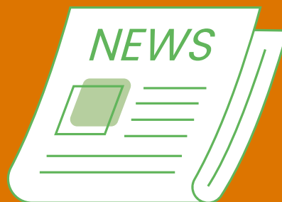
Ervaren gezondheid van inwoners met en zonder een gehoorbeperking In Zuid-Holland Zuid (Gezondheidsmonitor Volwassenen en Ouderen 2020)