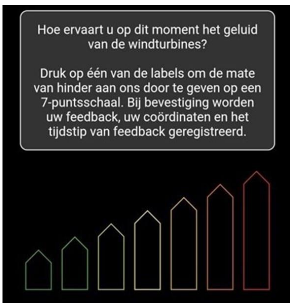
Figuur 1: voorbeeld 7-puntsschaal

In de Geluidsverwachting app kun je voor de beleving van geluid een score geven van 1 tot 7 (op een zevenpuntsschaal). Score 1 betekent dat er geen geluidshinder wordt ervaren en score 7 betekent dat er heel veel geluidshinder wordt ervaren. Ter illustratie kun je het voorbeeld bij figuur 1 bekijken.