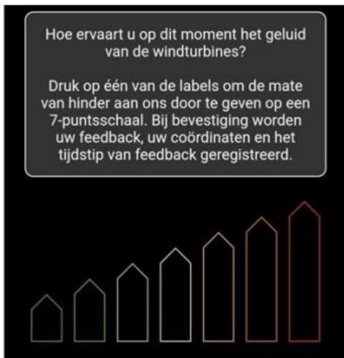
Figuur 1: voorbeeld 7-puntsschaal

In de Geluidsverwachting app kun je voor de beleving van geluid een score geven van 1 tot 7 (op een zevenpuntsschaal). Score 1 betekent dat er geen geluidshinder wordt ervaren en score 7 betekent dat er heel veel geluidshinder wordt ervaren. Ter illustratie kun je het voorbeeld bij figuur 1 bekijken.