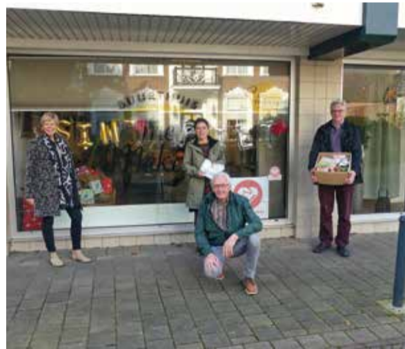
Foto uitreiking vorig jaar - Buurthuis Me Mekaer

Maar welke vrijwilligers en initiatieven moeten dit zijn? Dat bepaalt u door burgerinitiatieven te nomineren waarvan u vindt dat ze die speciale aandacht verdienen. Voor het nomineren van een initiatief kunt u op de website van de Vrijwilligerscentrale van Welzijn Hoeksche Waard het daarvoor bestemde formulier invullen. U kunt dat doen tot zaterdag 16 oktober.